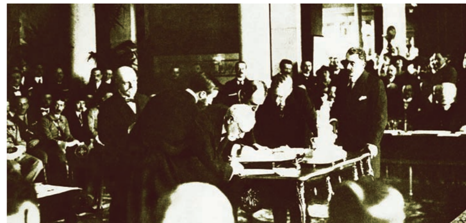
Ο Ελευθέριος Βενιζέλος υπογράφοντας τη Συνθήκη των Σεβρών, 1920

Παρουσίαση βιβλίου «Η απόφαση για την επέκταση της ελληνικής κυριαρχίας στη Μικρά Ασία: Κριτική επαναψηλάφηση»