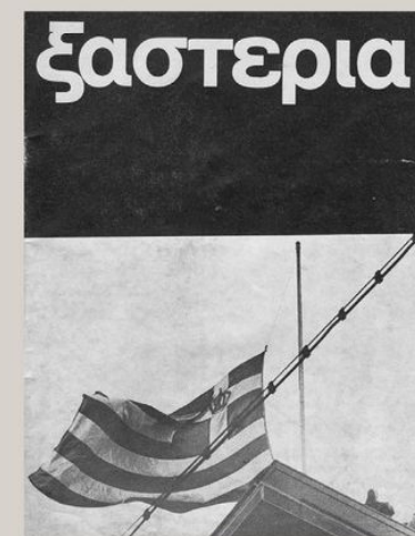
Εξώφυλλα από τα περιοδικά της Φοιτητικής Ένωσης Κρητών