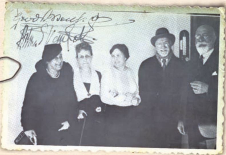
Τα ζεύγη Βενιζέλου και Δέλτα στο σπίτι των τελευταίων, στην Κηφισιά.

Ο Ελευθέριος Βενιζέλος αν και υπήρξε ο σημαντικότερος πολιτικός της σύγχρονης Ελλάδας, δέχθηκε πολλές δολοφονικές απόπειρες κατά της ζωής του. Εκτός από τις γνωστές απόπειρες στο σιδηροδρομικό σταθμό της Λυόν, στο Παρίσι το 1920 και στη λεωφόρο Κηφισίας το 1933, έγιναν δύο ακόμη, στις Αρχάνες Ηρακλείου στις 5 Αυγούστου 1897 και στη Θεσσαλία το 1912. Βέβαια υπήρξαν και άλλες προσπάθειες από τους πολιτικούς του εχθρούς να του αφαιρέσουν τη ζωή, οι οποίες παρέμειναν στο στάδιο του σχεδιασμού, καθώς για διάφορους λόγους ματαιώθηκαν χωρίς να τεθούν σε εφαρμογή. Συγκεκριμένα στη Θεσσαλονίκη το 1917, στην Αθήνα το Μάρτιο του 1918 και πάλι λίγο αργότερα τον ίδιο χρόνο, το καλοκαίρι του 1932 στη Λαμία, στην αίθουσα της Βουλής την 5η Μαΐου του 1933, στο σπίτι του απέναντι από το Βυζαντινό Μουσείο το 1933 και τέλος στο Φάληρο το ίδιο έτος.