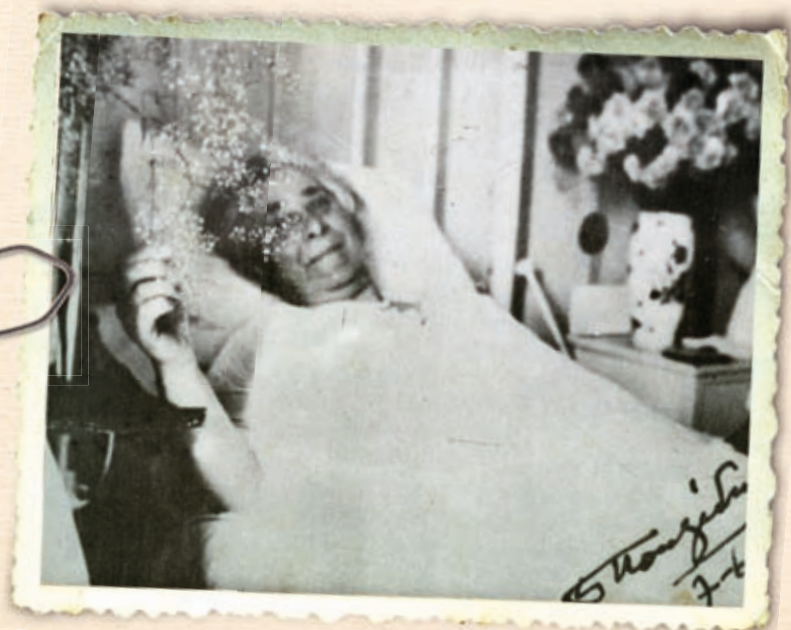
Η Έλενα Βενιζέλου στον Ευαγγελισμό μετά την απόπειρα του 1933.

Στο αυτοκίνητο επιβιβάστηκε ο Βενιζέλος με την Έλενα και δίπλα στον οδηγό Ιωάννη Νικολάου, κάθισε ο υπομοίραρχος Ιωάννης Κουφογιαννάκης. Το αυτοκίνητο του προέδρου ακολουθούσε το αυτοκίνητο της ασφάλειάς του, στο οποίο επέβαιναν οι Ανδρέας Γυπαράκης,