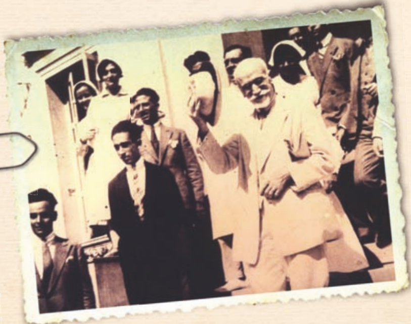
Ο Ελευθέριος Βενιζέλος εξερχόμενος από το Νοσοκομείο Ευαγγελισμός μετά την εναντίον του δολοφονική απόπειρα το 1933.

Η δίκη δεν τελείωσε ποτέ. Αναβλήθηκε «επ' αόριστον», καθώς μεσολάβησε το κίνημα της 1ης Μαρτίου του 1935. Έτσι, δύομιση χρόνια μετά την απόπειρα δολοφονίας εναντίον του Ελευθερίου Βενιζέλου οι κατηγορούμενοι απλά αποφυλακίστηκαν.