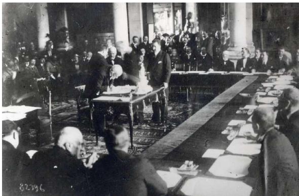
Ο Ελευθέριος Βενιζέλος ενώ υπογράφει τη Συνθήκη στο Δημαρχείο των Σεβρών 28/10 Αυγούστου 1920

για τους Έλληνες δε επισφράγιζε την εδαφική επέκταση της Ελλάδας και το δικαίωμα κατοχής και διοίκησης της Σμύρνης με προοπτική ενσωμάτωσης και σήμαινε την εκπλήρωση του οράματος της «Μεγάλης Ελλάδας».