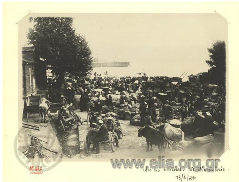
Από την εκκένωση της Νικομήδειας. 13/6/21

άτακτης οπισθοχώρησης έσπειρε πανικό μεταξύ των ελληνοορθόδοξων που προσπαθούσαν απεγνωσμένα να μετακινηθούν προς τα παράλια για να διαφύγουν στην Ελλάδα παρά την απαγόρευση του Έπατου Αρμολστή.