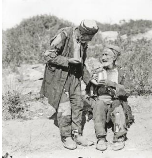
Πρόσφυγες από τη Μικρά Ασία, Αττική, 1922.

Το δράμα του 1922 επέφερε βαθιές τομές στην ελληνική κοινωνία σε επίπεδο κοινωνικοοικονομικό, πολιτικό, και πολιτισμικό και διαμόρφωσε τις προσλαμβάνουσες των επόμενων γενεών.