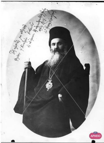
Ο Χρυσόστομος Σμύρνης

Ο Χρυσόστομος Σμύρνης λίγο πριν την διαφαινόμενη τραγωδία παρακινούσε απελπισμένος τον Βενιζέλο: «...μη διστάσητε να προβείτε εις εκατό κινήματα, ίνα σώσητε τώρα ολόκληρον τον απανταχού και ιδία τον μικρασιατικόν και θρακικό Ελληνισμόν...» 14 .