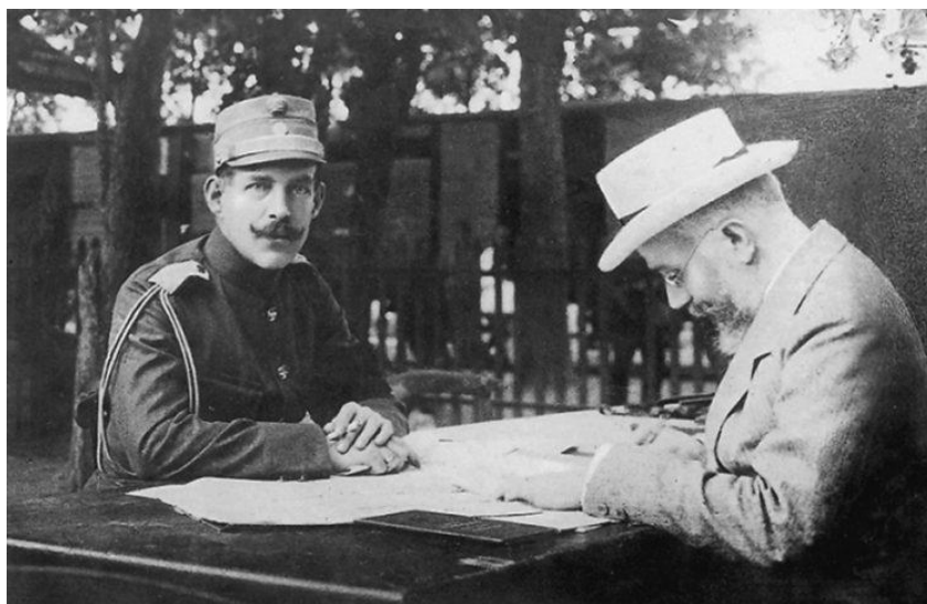
Ο βασιλιάς Κωνσταντίνος με τον Ελευθέριος Βενιζέλο στο Χατζή Μπεϊλίκ κατά τη διάρκεια του Β' Βαλκανικού Πολέμου, Ιούλιος 1913

«Και τώρα τα βλέμματά μας προς Ανατολάς».