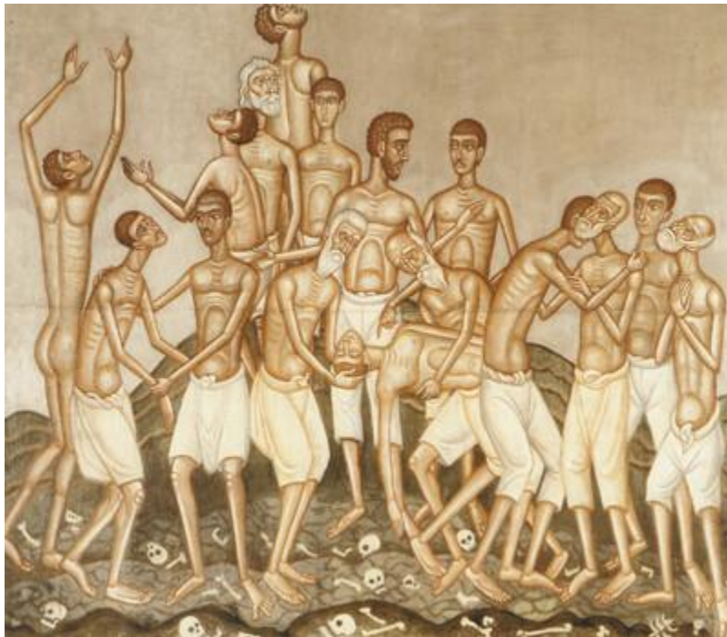
Φώτης Κόντογλου, «Πρόσφυγες - Η κοιλάδα του κλαυθμώνος», περίπου 1930, Ιδιωτική Συλλογή

Με την αλλοπρόσαλλη διαχείριση από την ελληνική κυβέρνηση και τον «παράφρονα και εγωιστή» 15 Υπάτο Αρμοστή Σμύρνης της τελικής φάσης της μικρασιατικής εκστρατείας και την υποχρεωτική ανταλλαγή πληθυσμών που ακολούθησε «ξεριζώθηκε τριών χιλιάδων χρόνων ελληνισμός, για να στερευωθεί ένας καταραμένος θρόνος που και δε στερεώθηκε!» 16 .