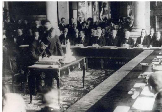
Οθωμανός πληρεξούσιος υπογράφει τη συνθήκη των Σεβρών

Η εγκατάλειψη του δόγματος περί οθωμανικής ακεραιότητας από τις Δυνάμεις μετά την γερμανική ενίσχυση του νεοτουρκικού εθνικιστικού κινήματος, καθώς και η στρατηγική θέση και το πλούσιο υπέδαφος της Μικράς Ασίας καθόρισαν τα αλληλοσυγκρουόμενα συμφέροντα Αγγλίας, Γαλλίας και Ιταλίας. Ο αμερικανικός παράγοντας εμφανιζόμενος δυναμικά στο Συνέδριο Ειρήνης υποχρέωσε τους συμμάχους να επανασχεδιάσουν τους επεκτατικούς τους στόχους. Η αποχώρηση της Ρωσίας από τη συμμαχία μετά τη Οκτωβριανή Επανάσταση 7 ευνόησε την προώθηση της Ελλάδας για την αποκατάσταση της πολιτικοοικονομικής και στρατιωτικής ισορροπίας στη Μικρά Ασία.