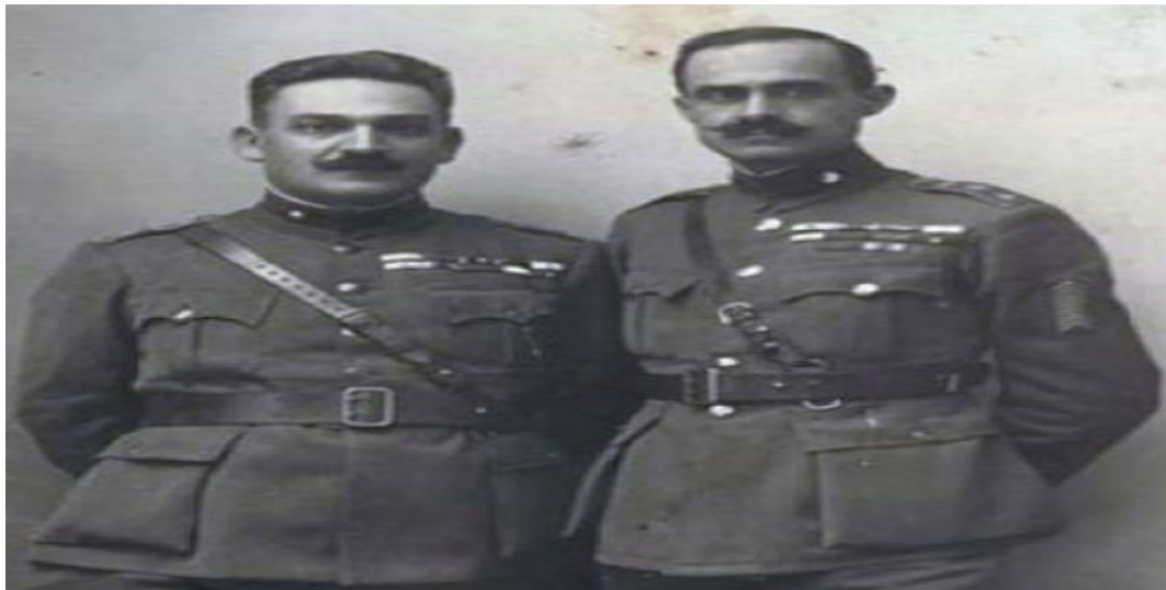
Οι Στ. Γονατάς και Ν. Πλαστήρας.

Η εκτέλεση των Έξι όπως ήταν φυσικό, αμαύρωσε την εικόνα της Χώρας, καθώς ο διεθνής Τύπος φιλοξένησε πολλά αρνητικά δημοσιεύματα για τη δίκη και την ατιμωτική εκτέλεση. Η διεθνής θέση της χώρας επιβαρύνθηκε τη στιγμή που ήταν απαραίτητη η στενή συνεργασία με τις Μ. Δυνάμεις, λόγω των διαπραγματεύσεων στη Λωζάννη. 8